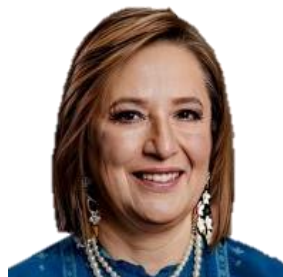
10. PAN-PRI-PRD Xóchitl Gálvez