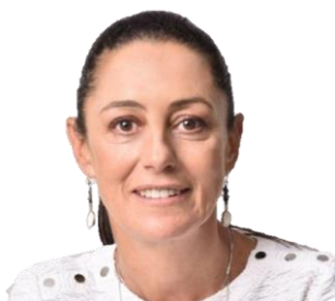
20. MORENA-PT-PVEM Claudia Sheinbaum