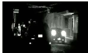
En Tototlán, Jalisco, más de la mitad de la cabecera municipal se quedó a oscuras por alrededor de media hora.

Al menos en 16 Estados del País registraron ayer apagones. Hasta la medianoche, el servicio eléctrico no estaba totalmente restablecido. Una sucesión de fallas en la generación eléctrica ocurrida entre las 16:00 y 19:00 horas de ayer colapsó al sistema de interconexión y dejó un margen de reserva operativa de apenas 3 por ciento. El Centro Nacional de Control de Energía (Cenace) declaró Estado Operativo de Emergencia. Para que el sistema eléctrico pueda operar en condiciones de seguridad necesita tener un margen de reserva