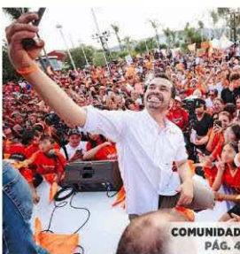
COMUNIDAD PÁG. 4