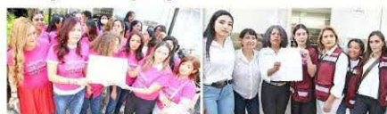
Aunque las denunciantes de ambas coaliciones coincidieron en el IEPC en la presentación de sus respectivas quejas, sus pronunciamientos los hicieron por separado.

Las mujeres se unieron contra Pablo Lemus. Debido a que presuntamente incurrió en violencia política de género al agredir verbalmente a sus contrincantes Claudia Delgadillo y Laura Haro, el candidato de Movimiento Ciudadano (MC) a la Gobernatura fue denunciado ayer ante el Instituto Electoral y de Participación Ciudadana (IEPC). El organismo electoral recibió dos quejas por separado por parte de mujeres integrantes de las coaliciones Sigamos Haciendo Historia en Jalisco (Morena, PVEM,